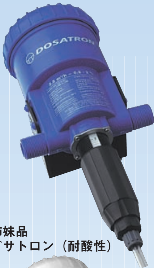
姉妹品 ドサトロン (耐酸性)