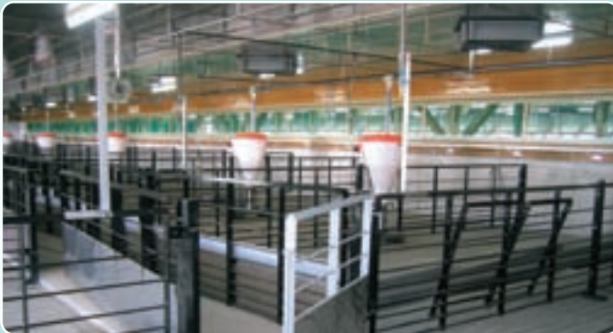
C2000インレットの設置状況(天井入気)