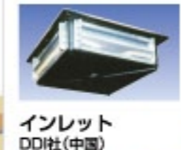
インレット DDI社(中国)