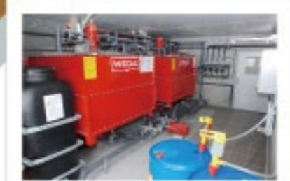
リキッド給餌システム WEDA社(ドイツ)