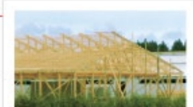
木造ギャングネイルトラス