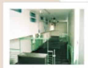
ナーサリーコンテナ 内部