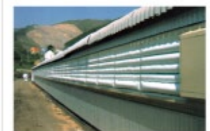
エアマットカーテン