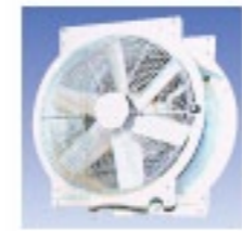
マルチファン フォスターマン社(オランダ)