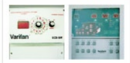
コントローラー (単相) コントローラー (三相)