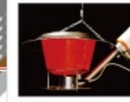
ガスヒーター-G12 ガソリック社(オランダ)