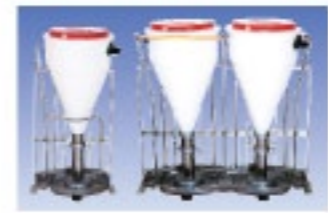
ココフィーダー ココ社(韓国)