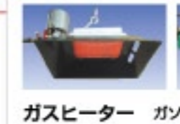
ガスヒーター ガソリック社(オランダ)