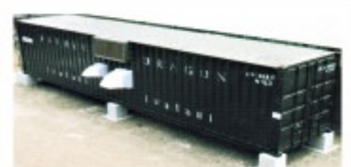
ナーサリーコンテナ DDI社(中国)