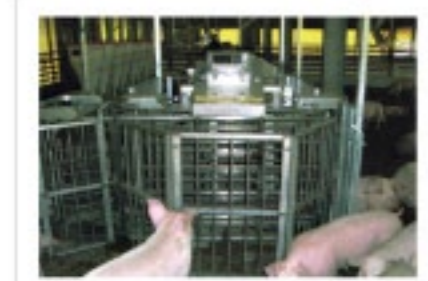
ソーティングシステム アーリンスケールズ社(アメリカ)