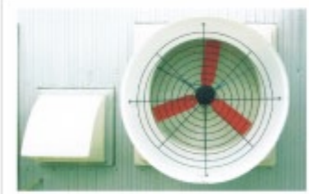
マルチファン フォスターマン社(オランダ)