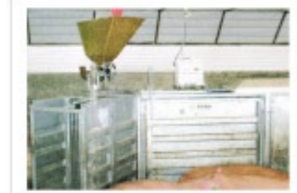
母豚群飼システム(TEAM) オズボーン社(アメリカ)