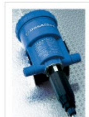
ドサトロン ドサトロン社(フランス)